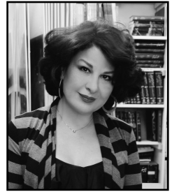
از نویسن معینی کرمانشاهی

در "مرواریدهای کف اقیانوس" انگیزه ی فیلمساز و خاستگاه او نمودی مشخص دارد. در این فیلم "رابرت آدانتو" شانزده زن ایرانی را که از سوی مجامع فرهنگی - هنری معتبر دنیا شناخته شده‌اند - انتخاب و با آنها مصاحبه کرده است. این فیلمساز با برخی از این هنرمندان، در یک نمایشگاه گروهی در موزه ی چلسی نیو